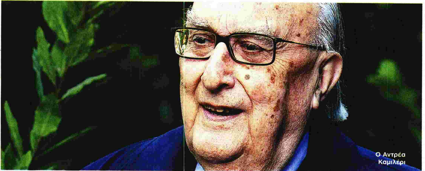
Ο Αντρέα Καμιλέρι

Με αφορμή τη δολοφονία ενός καλλιτέχνη-τοκογλύφου, ο Αντρέα Καμιλέρι αναφέρεται στην αγάπη για την τέχνη του θεάτρου, μα κυρίως σχολιάζει την ερωτική έλξη ανάμεσα σε άνδρες και γυναίκες κάθε ηλικίας