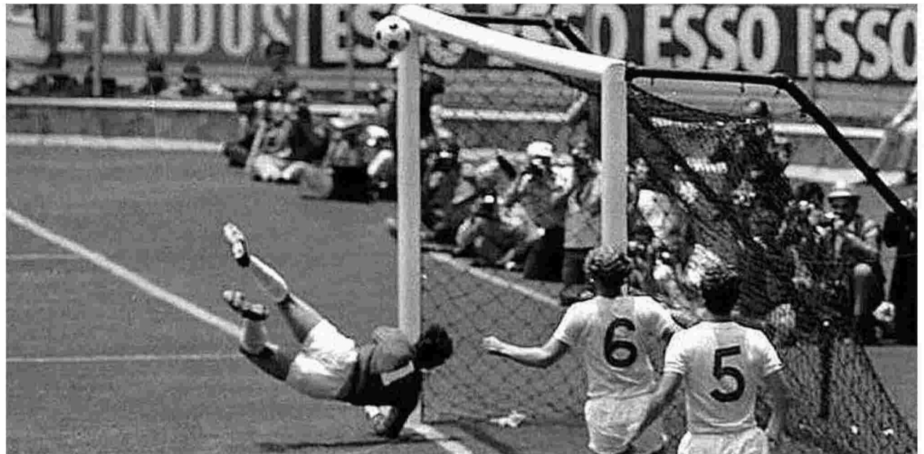
Ο Γκόρντον Μπανκς αποκρούει την τρομερή εξ επαφής κεφαλιά του Πελέ, στον αγώνα αναφοράς Βραζιλία-Αγγλία 1-0, για το Παγκόσμιο Κύπελλο του 1970.

Ο Πιέρ Πάολο Παζολίνι, λάτρης του ποδοσφαίρου και της Εθνικής Βραζιλίας, καθώς και ο ίδιος έπαιζε μπάλα, διαχώριζε τις ομάδες ανάμεσα σ' εκείνες που αναπτύσσουν «προζαϊκά» χαρακτηριστικά στο παιχνίδι τους και τις άλλες που αναδείκνυαν «ποιητικά» στοιχεία: το ευρωπαϊκό ποδόσφαιρο των «συστημάτων» και εκείνο των λατινοαμερικανικών ομάδων. Από τη χώρα του Σέζαρ Λούις Μενότι (τον οποίο περιέργως «αποσιωπά» ο Σάμιον Κρίτολυ), του επονομαζόμενου και «ξερακιανού» (el flaco), αρχιτέκτονα της κατάκτησης του (ματωμένου) Παγκοσμίου Κύπελλου, το 1978, στην Αργεντινή του δικτάτορα Βιντέλα (για την οποία είχε δηλώσει με δελφική αμφισημία «Οι παίκτες μου νίκησαν τη δικτατορία της τακτικής και την τρομοκρατία του συστήματος»), προέρχεται και ο Ρομπέρτο Φονταναρρόσα (1944-2007), με το παρατσούκλι «μαύρος» (El Negro), γελοιογράφος, κομιξιάς, συγγραφέας, φανατικός οπαδός της Ροσάριο Σεντράλ (όπως και ο Τσε Γκεβάρα, γεννημένος στο Ροσά-