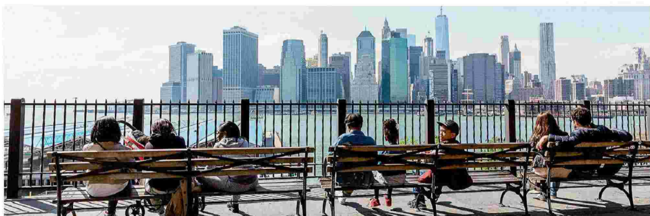
«Την πιο πολλή ώρα μου φαίνεται εξωπραγματικό», λέει ο Σάιμον Κρίτολεϊ από το διαμέρισμά του στο Μπρούκλιν (φωτ.) της Νέας Υόρκης, στην ερώτησή της «Κ» σχετικά με το πώς βιώνει τις ημέρες του με την πανδημία του κορωνοϊού και τα μέτρα τα οποία έχουν ληφθεί.

«Νομίζω πως πραγματικά χρειαζόμαστε ένα υπερβατικό, άσεμνο, μαύρο χιούμορ για να αντέξουμε και να καταλάβουμε τι συμβαίνει. Οι άνθρωποι πεθαίνουν στον δρόμο, ζούμε κάτι σαν τον Μεσαίωνα με τους νεκρούς της πανώλης να θάβονται σε μαζικούς τάφους στη Νέα Υόρκη. Αν πραγματικά μπορούσαμε να νιώσουμε τον πόνο από τον τόσο θάνατο που είναι γύρω μας θα τρελαινόμασταν. Έτσι για να το αντιμετωπίσουμε αυτό πρέπει να γίνουμε απάνθρωποι και το χιούμορ το κάνει αυτό», μας λέει. Επικαλείται τον Ανρί Μπεργκσόν και την πραγματικότητα του για το γέλιο