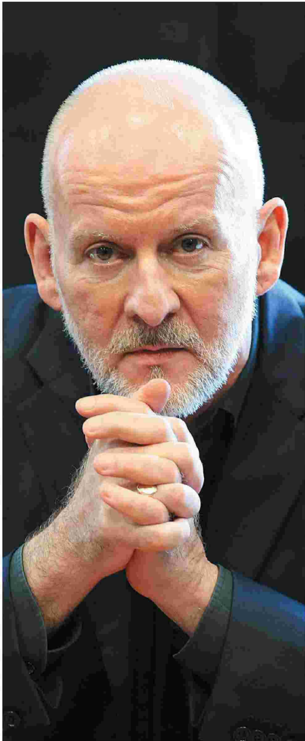
«Αρκετή φιλοσοφία έχει παραχθεί σε καιρούς απομόνωσης», σημειώνει ο καθηγητής φιλοσοφίας Σάιμον Κρίτολεϊ.

«Σκέφτομαι εκείνη την κρίση και το γεγονός ότι τα μοντέλα ανάλυσης δεδομένων που χρησιμοποιούσαν οι οικονομολόγοι αποδείχθηκαν λανθασμένα και ανησυχώ για την εμμονή μας με την επιδημιολογία και το πώς όλοι γίναμε ειδικοί στους ιούς. Αναρωτιέμαι μήπως για κάποια από τα μοντέλα αποδειχθεί ότι βρίσκονται μακριά από την πραγματικότητα και αυτό κλονίσει την πίστη μας στην επιστήμη των δεδομένων». Ο εγκλεισμός, ωστόσο, στο σπίτι κάνει καλό, λέει γελώντας, στη φιλοσοφία