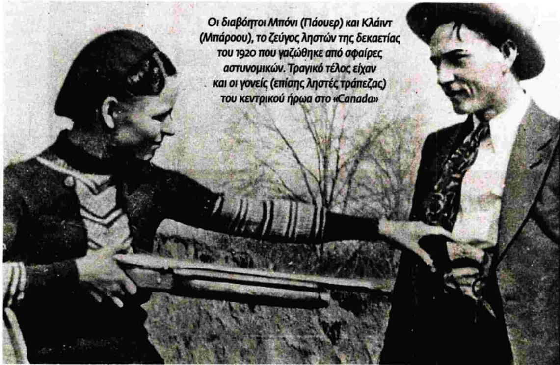
Οι διαβόητοι Μπόι (Γάουερ) και Κλάιντ (Μπάροου), το ζεύγος ληστών της δεκαετίας του 1920 που γαζώθηκε από σφαίρες αστυνομικών. Τραγικό τέλος είχαν και οι γονείς (επίσης ληστές τράπεζας) του κεντρικού ήρωα στο «Canada»