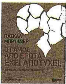
Το εξώφυλλο του τελευταίου βιβλίου του

Ο Πασκάλ Μπρικνέρ ως «νέος φιλόσοφος» δεν είχε ποτέ το αλαζονικό ύφος ενός Μπερνάρ-Ανρί Λεβί ή ενός Αλέν Φινκελκρότ. Και μοιάζει πλέον να έχει διαχωρίσει τη θέση του από τους παλιούς συνοδοιπόρους του, που έτσι κι αλλιώς ως κίνημα αμφισβήτησης της αριστερής σκέψης έχασαν την αίγλη τους, καθώς παγιδεύτηκαν σε μια συντηρητική ματιά στα πράγματα και σε αμφιλεγόμενες πολιτικές εμπλοκές. Στη μακρά τηλεφωνική συνέντευξη που έδωσε λοιπόν στα «NEA» με αφορμή την ομιλία του την ερχόμενη Τρίτη στην Αθήνα, ακουγόταν πολύ προβληματισμένος για το μέλλον των ευρωπαϊκών κοινωνιών. Και έδειξε ότι οι φόβοι του δεν αφορούν μονάχα την οικονομία, αλλά μπαίνουν βαθιά στα θέματα της κοινωνικής συνοχής και φθάνουν μέχρι τα κρεβάτια των Ευρωπαίων. Μην ξεχνάμε πως υπήρξε από τους διανοούμενους που έκαναν σημαία τους τα ερωτικά ζητήματα.