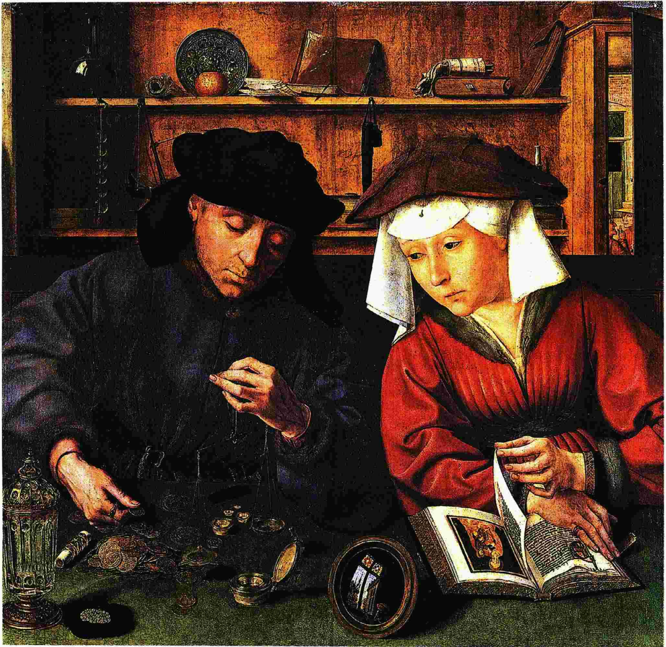
«Ο αργυρομοιβός και η σύζυγός του», πίνακας του φλαμανδού ζωγράφου Κουέντιν Μάτσις (1514)