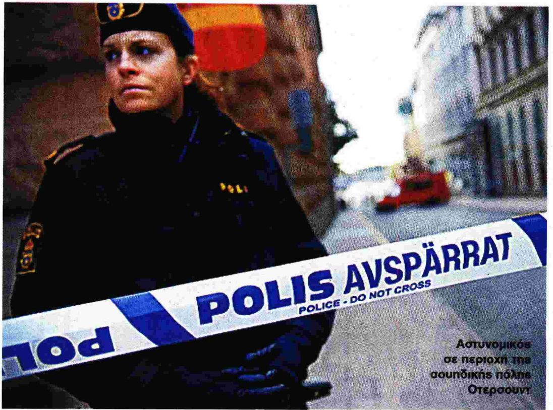
Αστυνομικός σε περιοχή της σουηδικής πόλης Οστερσουντ

Ο αστυνόμος Μπέκστρεμ έλκει την καταγωγή από την τριλογία της «Ιστορίας του εγκλήματος», όπου αποτέλεσε τον αποδιοπομπαίο τράγο και στόχο σκληρών επιθέσεων του υποδειγματικού αρχηγού της αστυνομίας Γιούχανσον. Οχι μόνο όμως κατόρθωσε να επιβιώσει, αλλά αποδείχτηκε αρκούντως αποτελεσματικός στην εξιχνίαση πολλών υποθέσεων. Ο διαστροφικός δεξιο-