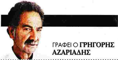
ΓΡΑΦΕΙΟ ΓΡΗΓΟΡΗΣ ΑΖΑΡΙΑΔΗΣ

Η δολοφονία ενός αμφιλεγόμενου δικηγόρου «της μουσουλμανικής μαφίας» ως εύρημα που αποκαλύπτει το σκοτεινό υπόβαθρο της σουηδικής κοινωνίας στη «Μύτη του Πινόκιο»