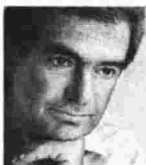
Γράφει ο Μιχάλης Μοδινός

Σε μια φτωχή οικογένεια μεγάλωσε και ο Αλμπέρ Καμύ, ορφανός μάλιστα κατά το ήμισυ, καθώς ο επιστάτης σε μια αμπελοργαία πατέρας του είχε σκοτωθεί υπηρετώντας τη μητέρα πατρίδα στα χαρακώματα του Α' Παγκοσμίου Πολέμου. Παρ' όλα αυτά ο Αλμπέρ θα επωφελείτο της πολύ καλής παιδείας που παρεχόταν στην ιδιότητα αυτή αποικία, θα ξεκινούσε το γράψιμο νωρίς, θα μάθαινε να εκτιμά την ομορφιά και τα δώρα της ζωής, θα εντρυφούσε στους κλασικούς, θα έγραφε τη διατριβή του με θέμα «Μεταφυσική του Χριστιανισμού και του Νεοπλατωνισμού» πραγματοποιώντας τις σχέσεις μεταξύ ελληνικής και χριστιανικής παράδοσης με ειδική αναφορά στον Πλωτίνιο και τον Αυ-