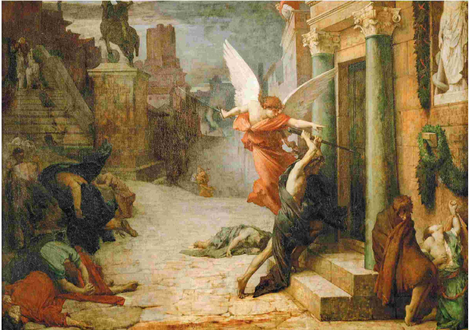
Η πανώλη χτυπάει τη Ρώμη από το 165 έως το 180 μ.Χ., γνωστή και ως «πανώλη του Γαλνούς», από τον Κλαύδιο Γαλνό που την έζησε και την κατέγραψε. Έργο του 1869, από τον Γάλλο ζωγράφο Ζιλ-Ελί Ντελονέ, εμπνευσμένο από το χρονικό «Legenda Aurea» του χρονικογράφου και αρχιεπισκόπου της Γένοβας Τζάκοπο ντε Φάτσιο (1230-1298).

Η επιδημία μάς υπενθυμίζει ότι ανήκουμε σε μια συλλογικότητα. Μας ωθεί να συμπεριφερόμαστε με τρόπο αδιανόητο υπό κανονικές συνθήκες, να αναγνωρίζουμε δηλαδή ότι είμαστε άρρηκτα συνδεδεμένοι με τους άλλους ανθρώπους και να παίρνουμε υπόψη την ύπαρξη και την ευημερία τους στις αποφάσεις μας επιλογές. Στο περιβάλλον της επιδημίας ανακαλύπτουμε τον εαυτό μας ως κομμάτι ενός εν-