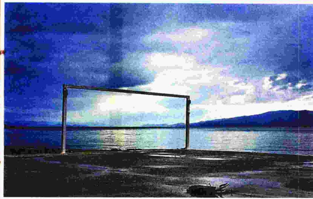
ΑΡΧΗΣ ΠΑΥΛΟΣ / ΕΠΙΧΡΑΤΗΣ