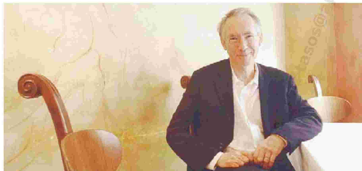
Ο Βρετανός συγγραφέας Ιαν ΜακΓιούαν ανήκει στην εμπροσθοφυλακή της σύγχρονης λογοτεχνίας.

Η Σερίνα Φόρουμ, κεντρική ηρωίδα και αφηγήτρια της ιστορίας μας, φοιτήτρια ακόμη