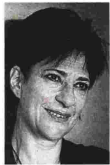
Tns Μικέλας Χαριτουήρη

Ο Πέτρος Χατζόπουλος μεγάλωσε με μια μητέρα μανιοκαταθλιπτική, σε ένα περιβάλλον όπου η αγάπη προσπαθούσε να πολεμήσει την αρρώστια. Τελικά, νίκησε η αρρώστια. Ο Πέτρος βρήκε τη μητέρα του νεκρή από τα 400 χάπια που είχε καταπιεί για να τον απαλλάξει «από τη δυστυχία μιας μοναχικής ζωής χαμένης για να γεμίσει την έρημο μιας άλλης». Ήταν 23 χρονών και είχε ήδη γίνει ο συγγραφέας Αύγουστος Κορτώ με τρία σκληρά μυθιστορήματα Σαντικής πνοής στο ενεργητικό του ( Το βιβλίο των βίτσιων, Ραμπασιέν, Τετράγωνο , εκδ. Εξάντας). Τώρα είναι 34 χρονών με 19 τίτλους στο ενεργητικό του, η θεματολογία του έχει διευρυνθεί και μόλις κυκλοφόρησε το Βιβλίο της Κατερίνας (Πατάκης): ένα σπαρακτικό αυτοβιογραφικό αφήγημα, όπου ο Πέτρος/Αύγουστος μιλάει με τη φωνή της μάνας του σε πρώτο πρόσωπο. Ο Κορτώ ανασυσταίνει την τραυ-