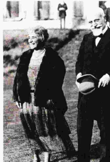
Τον Σεπτέμβριο του 1921 ο Ελευθέριος Βενιζέλος παντρεύεται στο Λονδίνο (αριστερά) την Ελενα Σκυλίτση, κόρη μιας πλούσιας οικογένειας από τη Χίο.

καταγράψει και να επαναπατρίσει τους Έλληνες. Και τι έκανε; Αντί τάχιστα να μου αποστείλει υπηρεσιακά τη σχετική έκθεση στη Διάσκεψη του Παρισιού ώστε να την έχω για τη σύνταξη του Υπομνήματος προς τους Τρεις και στο οπλοστάσιό μου στις διαπραγματεύσεις για τον Πόντο, ήλθε με μεγάλη καθυστέρηση αυτοπροσώπως τον Αύγουστο στο Παρίσι -κατόπιν εορτής-, δίχως έγκριση της κυβέρνησης, να μου κάνει προφορική ενημέρωση. Επιδίωκε ντε φάκτο να κολλήσει στην αντιπροσωπεία... για να γνωριστεί με τα υψηλά πνεύματα της Γαλλίας, ενώ εγώ καιγόμουν για την εθνογραφική αποτύπωση της Μαύρης Θάλασσας».