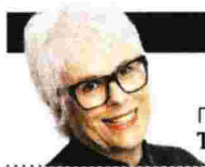
ΓΡΑΦΕΙ Η ΚΙΚΗ ΤΡΙΑΝΤΑΦΥΛΛΗ

Βασίλης Βασιλικός ΠΕΡΙ ΛΟΓΟΤΕΧΝΙΑΣ ΚΑΙ ΑΛΛΩΝ ΔΑΙΜΟΝΙΩΝ Εκδ. Gutenberg, Σελ. 368 Τιμή: 19 ευρώ