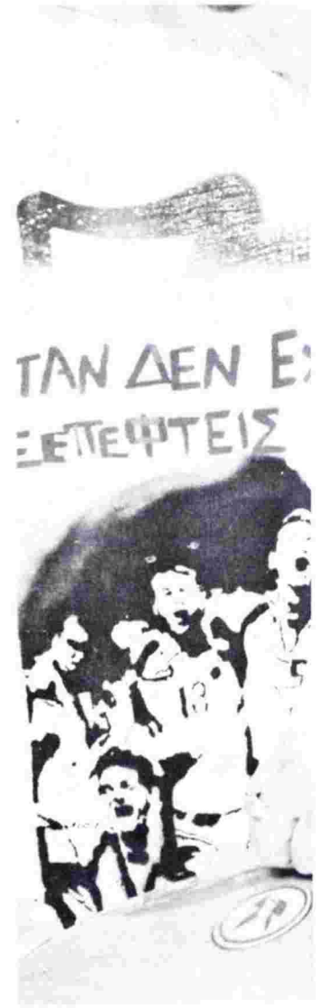
ρρισσότερο από τον Μαρξ αλλά και από τη σημερινή ΑΝΤΑΡΣΙΑ. Τι μήνυμα κουβαλάει για τον αναγνώστη σας ο Μπακούνιν; Ο Μπακούνιν πίσω από τα

Εντέλει, δεν είναι υπερβολή να πούμε ότι μισόν αιώνα μετά τον Τσίρκα, η Μάρω Δούκα ολοκληρώνει ένα έργο πνοής αντίστοιχης με τις Ακυβέρνητες Πολιτείες . Το Αθώοι και φταίχτες (2004), το Δίκιο είναι ζορικό πολύ (2010) και το Ελα να πούμε ψέματα (2014) είναι η δική της Τριλογία με τίτλο «Στις γραμμές του μύθου και της ιστορίας», η οποία ξεκινά από τη γενέθλια πόλη της, τα Χανιά, και αποκτά προοπτική οικουμενική.