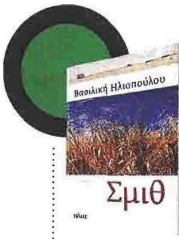
Βασιλική Ηλιοπούλου Σμιθ Εκδόσεις Πόλις

Στο καινούργιο του μυθιστόρημα ο Γιάννης Ξανθούλης συναντά το φάντασμα της Σιλάνας Σαλιάγκου, της ποιήτριας που υπήρξε αποκύμα της φαντασίας του, και εμφανίστηκε «σαν άγγελος λοξής έμπνευσης», όταν εκείνος ξεκίνησε να κάνει μυθιστόρημα το διάστημα της εφηβείας του που πέρασε στην επαρχία. «Η κυρία Σιλάνια Σαλιάγκου για μένα υπήρξε άλλοθι», ομολογεί ο ίδιος σε πρώτο πρόσωπο, προσθέτοντας, «τη γέννησα ώριμη, στοχαστική, με μια δυνατή νοσταλγία και με θαυμασμό στην αζεπέρραστη ποιητική ανορθογραφία του Μπρεστ (...)». Η Σιλάνια παίρνει σάρκα και οστά και εκδικείται τον συγγραφέα, οξύνοντας τη μνήμη του για πράγματα που νόμιζε ότι έχει αφήσει πίσω του.