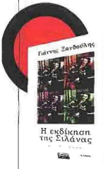
Γιάννης Ξανθούλης Η εκδίκηση της Σιλάνας Εκδόσεις Ελληνικά Γράμματα

Στο καινούργιο του μυθιστόρημα ο Γιάννης Ξανθούλης συναντά το φάντασμα της Σιλάνας Σαλιάγκου, της ποιήτριας που υπήρξε αποκύμα της φαντασίας του, και εμφανίστηκε «σαν άγγελος λοξής έμπνευσης», όταν εκείνος ξεκίνησε να κάνει μυθιστόρημα το διάστημα της εφηβείας του που πέρασε στην επαρχία. «Η κυρία Σιλάνια Σαλιάγκου για μένα υπήρξε άλλοθι», ομολογεί ο ίδιος σε πρώτο πρόσωπο, προσθέτοντας, «τη γέννησα ώριμη, στοχαστική, με μια δυνατή νοσταλγία και με θαυμασμό στην αζεπέρραστη ποιητική ανορθογραφία του Μπρεστ (...)». Η Σιλάνια παίρνει σάρκα και οστά και εκδικείται τον συγγραφέα, οξύνοντας τη μνήμη του για πράγματα που νόμιζε ότι έχει αφήσει πίσω του.