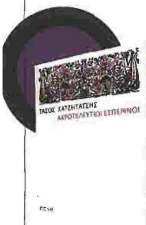
Τάσος Χατζητάσης Ακροτελείπιοι Εσπερινοί Εκδόσεις Πόλις

Άνθρωποι, κατοικίδια ζώα και ηλεκτρικές συσκευές παίρνουν τον λόγο και διηγούνται την ιστορία τους. Ένας μικρός, άσπρος «σπιτικός» σκύλος νιώθει ξένος στον κόσμο. Μια γυναίκα, στη φάση ψήφω του άνθρωπου της ζωής μου». Οικογενειακοί και βιβλιοσμοί. Ο γάμος, μια «ισόβια ιαχή πόνο». Συγκεντρώσεις φίλων. Η ανάγκη επίδειξης της επιτυχίας ως αντίδοτο για την απουσία της ευτυχίας. Ένα μικρό παιδί ζωγραφίζει τα παραμύθια του, βήμα βήμα προς τη σκληρή ενηλικίωση. Το δράμα ενός πατέρα που ο γιος του θέλει να γίνει μουσικός κι όχι επιστήμονας. Κι ένα σουρεαλιστικό ιντερμέδιο: πόσα χαμένα μεροκάματα χρεάζονται για να συνομιληθείς με τον ασφαλιστικό σου φορέα;