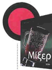
Γιώργος Μανιωτής Μίξερ Εκδόσεις Ελληνικά Γράμματα

Είκοσι επτά διηγήματα που μετεωρίζονται μεταξύ μιας υπέρθενης μοίρας και του σουρεαλισμού της πραγματικότητας, μεταξύ σφύρας και Αλιάκμονος, και «πατούν» σε θέματα σταθερά, που φεύγουν κι έρχονται στη θεματολογία του Γιώργου Σκαμπαρδώνη. Τα σκοτεινά μέρη, οι αναδιπλώσεις της μνήμης, οι εμμονές με τη θάλασσα, το νερό και την απώλεια, οι δύσκολες σχέσεις, η φθορά, εκείνη η καιρία στιγμή που φέρνει την αλλοίωση και σε ορίζει. Πρόκειται για διηγήματα γραμμένα μεταξύ 2004 και 2009, που μιλούν για «μεγάλες» χειρονομίες οι οποίες γλυκαίνουν παλιές αμαρτίες και κάνουν το κενό να ακούγεται σαν μουσική που γεμίζει τις ρωγμές και παρηγορεί.