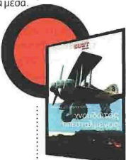
Εκτορας Αποστολόπουλος Χνουδωτός Απεσταλμένος Εκδόσεις Τόπος