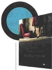
Θεόδωρος Γρηγοριάδης Δεύτερη Γέννα Εκδόσεις Πατάκη

Η καθημερινότητα της Ελλάδας του 1956, όπου τίποτα δεν είναι αθώο και όλα καλύπτονται από το φάσμα μιας οδυνηρά συντριπτικής πραγματικότητας, που δεν αφήνει χώρο ούτε για τα όνειρα. Οι ήρωες ζουν τα αδιέξοδα της χώρας σε προσωπικό και συλλογικό επίπεδο, και φέρουν ταυτόχρονα το στοιχείο του τραγικού αλλά και του κωμικού, προσπαθώντας να συμβιβαστούν επιθυμίες και καταναγκασμούς. Η ακροβασία τους μεταξύ ζωής και θανάτου, βίας και τρυφερότητας, διδύχου αισθησιασμού και παραλυτικού φόβου νοσηματοδοτούν την πλοκή με αναπάντεχο τρόπο. Το μυθιστόρημα διαθέτει υπόγειο ένταση, γρήγορο ρυθμό, περάσματα από το πραγματικό στο φανταστικό και όλα αυτά με υπαινιγμούς, ειρωνεία και λιτά μέσα.