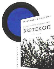
Ιερώνυμος Πολλάτος Ο σκοτεινός κύριος του Βέρτεκοπ Εκδόσεις Το Ροδακί

«Η προσπάθεια να πεις κάτι που αντήχει (κυριολεκτικά και μεταφορικά) χρησιμοποιώντας τον λιγότερο δυνατό χώρο» αποτελεί τον κοινό άξονα αυτής της συλλογής σύντομων, αυτόνομων αφηγημάτων με τίτλο Χνουδωτός Απεσταλμένος . Ο αναγνώστης έχει την ευκαιρία να έρθει σε επαφή με αλλόκοτους ήρωες, σε απίθανες καταστάσεις, με στόχο τη σάτιρα και τον καιρίο σχολασμό του έρωτα, της εργασίας, της καθημερινότητας, των συγγραφών, των φιλοσόφων, των πρώτων των παραμυθιών, των αναγνώστων, και, προπάντων, της χρήσης της γλώσσας. Μια απολαυστική πρόξα που καλεί σε επαναληπτικές αναγνώσεις, προκειμένου να αποκαλυφθεί η αλήθεια και η ευρηματικότητα της.