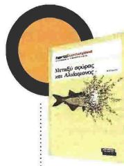
Γιώργος Σκαμπαρδώνης Μεταξύ σφύρας και Αλιάκμονος Εκδόσεις Ελληνικά Γράμματα

Μια σύγχρονη ιστορία που χωρίζεται σε τρεις ενότητες, καλύπτοντας το τριήμερο Παρασκευή-Σάββατο-Κυριακή, οπότε μια γυναίκα από την Καβάλα κατεβαίνει στην Αθήνα για να γιορτάσει τα γενέθλια της κόρης της. Τη βρίσκουμε στο σημείο που στοιχειωμένη από φόβους, θολές μνήμες και αβέβαιες σκέψεις πρόκειται να λυτρωθεί και να αποδεχτεί την αλήθεια ως μάνα και ως γυναίκα. Μια εξομολογητική αφήγηση με τα βασικά στοιχεία που τροφοδοτούν τη ζωή και την τέχνη, τη γέννηση, τον έρωτα και τον θάνατο, που φιλτράρεται μέσα από τις εμμονές της βόρειας χώρας, των εσωτερικών μεταναστεύσεων, της άγρυπνης νύχτας, των άδειων λημιών της ψυχής και της απουσίας δσων αγαπήσαμε.