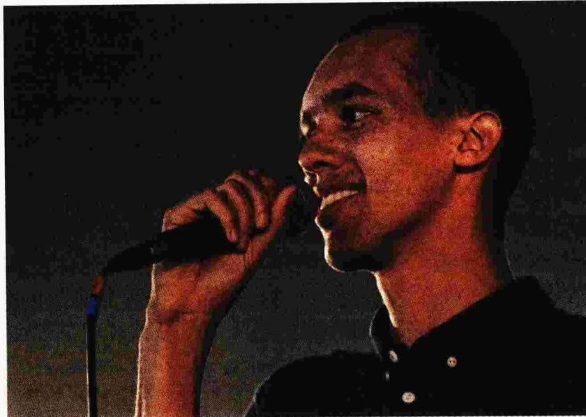
Ο γαλλορουαντέζος ράπερ και συγγραφέας Γκαέλ Φάιγ.

Με πολύ μικρές εξαιρέσεις, η αυτοβιογραφική αυτή αφήγηση τα καταφέρνει θαυμάσια να αποδώσει τον χαρακτήρα της βίας, το μίσος, τον αλληλοσπαραγμό, την αδυναμία του ήρωα να διατηρήσει μια στάση ουδετερότητας, τις βαθύτατα ταξικές αλλά και φυλετικές διαιρέσεις που είχαν οξυνθεί κατά τα χρόνια της Αποικιοκρατίας. Σημειωτέον ότι, υπό τη γερμανική και αργότερα (μετά τον Α΄ Παγκόσμιο Πόλεμο) τη βελγική διακυβέρνηση, οι δύο χώρες είχαν αποτελέσει ενότητα με την ονομασία Ρουάντα-Ουρούντι και διαχωρίστηκαν ξανά μόνο με την ανεξαρτησία, στις αρχές δηλαδή της δεκαετίας του 1960. Οι Βέλγοι ειδικά κυβέρνησαν διαιωνίζοντας την κυριαρχία των Τούτσι βασιλιάδων και ευγενών, οι δυναστείες των οποίων πάνε πολύ πίσω στο χρόνο. Ανήκοντας πιθανότατα στα λεγόμενα σουδανονιλοτικά φύλα –αν και πρόσφατες γενετικές έρευνες τους κατατάσσουν στους Μπαντού, όπως άλλωστε και τους Χούτου-, οι ψηλόλιγνοι, ανοιχτού χρώματος κτηνοτρόφοι Τούτσι «με τις λεπτόσχιμες μύτες» θα κυριαρχούσαν σταδιακά επί των γηγενών πυγμαίων και των αγροτών /καλλιεργητών Χούτου, πιο μικρόσωμων και «με χοντρή μύτη», όπως άλλωστε εξηγεί ο πατέρας του Γκαμπριέλ εισαγωγικά. Οι απο-