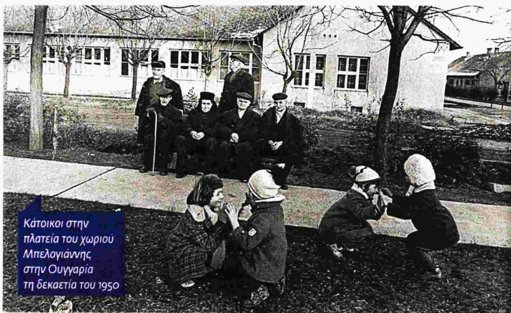
Κάτοικοι στην πλατεία του χωριού Μπελογιάννης στην Ουγγαρία τη δεκαετία του 1950