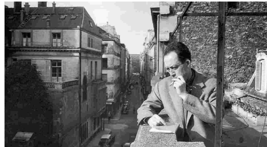
Ο Αλμπέρ Καμύ στο διαμέρισμά του στο Παρίσι το 1957. Στα «Σημειωματάρια», ο συγγραφέας καταγράφει αναμνήσεις, σκέψεις, ιδέες.

λείται με θέματα υπαρξιακά, αρνείται ότι οι θέσεις του έχουν σχέση με τον υπαρξισμό. Αλλωστε, δεν επιθυμεί να κατατάξει τις απόψεις του σε ένα φιλοσοφικό σύστημα, αν και στον «Μύθο του Σισύφου» αλλά και στον «Επαναστατημένο άνθρωπο» αναζητεί το νόημα της ζωής, βασικές έννοιες στο έργο του, όπως και αυτές του παραλόγου και της εξέγερσης, ιδωμένες σε σχέση με τις αντιθέσεις: ζωή και θάνατος, φως και σκοτάδι, ευτυχία και δυστυχία. Και αν κάποιος μπορούσε να αποδεχτεί αυτές τις αντιθέσεις της καθημερινότητας, πώς να αποδεχτεί την παραδοξότητα της ακόλουθης ιδέας: «Η ζωή μας έχει μεγάλη αξία, αλλά δεν έχει νόημα». Πώς συμφιλιώνεται, όμως, αυτή η αντίθεση; Ή, όπως γράφει στη «Δεύτερη επιστολή σ' ένα φίλο Γερμανό» («Γράμματα σ' ένα φίλο Γερμανό», Πατάκης, 2013): «Αν τίποτε δεν έχει νόημα, έχεις δίκαιο. Ωστόσο, υπάρχει κάτι που έχει νόημα». Μια αντίφαση που επιτείνει την παρα-