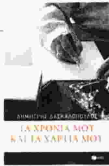
Δημήτρης Δασκαλόπουλος ΤΑ ΧΡΟΝΙΑ ΜΟΥ ΚΑΙ ΤΑ ΧΑΡΤΙΑ ΜΟΥ Εκδ. Πατάκη 2016, σελ. 326 Τιμή: 15 ευρώ