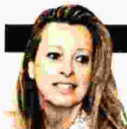
ΓΡΑΦΕΙ Η ΚΙΡΚΗ ΚΕΦΑΛΕΑ

Κύριο στοιχείο της ζωής του είναι, και υπήρξε πάντα, η λογοτεχνία. Κριτικός, μελετητής, βιβλιογράφος αλλά και ποιητής, τώρα και πεζογράφος, κάνει «έφοδο» στα ράφια των βιβλιοπωλείων με τρία νέα βιβλία, εκθέτοντας στο κοινό «Τα χρόνια μου και τα χαρτιά μου»