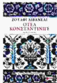
Zulfu Livaneli ΟΤΕΛ ΚΩΝΣΤΑΝΤΙΝΙΓΕ

Εγγραφα μουσική για πάνω από 30 φιλμ. Συνεργάστηκα με τον Γιλμάζ Γκιουνέ. Ο Γιασάρ Κεμάλ μου ζήτησε να μεταφέρω στον κινηματογράφο ένα βιβλίο του, ενώ αγαπώ πολύ τις ταινίες του Θεόδωρου Αγγελόπουλου. Τον θεωρώ τον καλύτερο σκηνοθέτη του 20ού αιώνα και μου αρέσει πολύ και ο φωτογράφος του - όταν είχα δει τον «Θίασο», είχα πάθει σοκ. Ασχολήθηκα λοιπόν αρκετά με τον κινηματογράφο. Και δεν νομίζω να συνεχίσω. Σε λίγο καιρό η «Σερενάτα» θα γίνει ταινία, αλλά δεν θέλω να ανακατευτώ. Έτσι κι αλλιώς, δεν έκανα ταινίες και δίσκους, δεν έγραφα βιβλία για να λάμψω όσο το δυνατόν περισσότερο. Το έκανα γιατί είχα την ανάγκη να εκφραστώ με διαφορετικούς τρόπους.