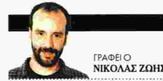
ΓΡΑΦΕΙ Ο ΝΙΚΟΛΑΟΣ ΖΩΗΣ

Με αφορμή την κυκλοφορία του τελευταίου του μυθιστορήματος «Οτέλ Κωνσταντινίγε», ο τούρκος συγγραφέας, μουσικοσυνθέτης και σκηνοθέτης μιλάει για τα τουρκικά εστιατόρια της Αθήνας, τον οργισμένο Ερντογάν ή για τον Μίκη, «τον μεγάλο του αδερφό»