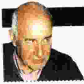
ΓΡΑΦΕΙΟ ΘΑΝΑΣΗΣ Θ. ΝΙΑΡΧΟΣ

Τ α εξαιρετικά πλεονεκτήματα του μυθιστορήματος του Νίκου Βουδούρη «Καϊάφας» ξεκινάνε από το οπισθόφυλλο – επιτέλους ένα οπισθόφυλλο τόσο καίριο και παραστατικό ώστε να σε προϋδεάζει σε σχέση μόνον με ό,τι πρόκειται να διαβάσεις, χωρίς να βροντοφωνάζει ή έστω να υπαινίσσεται ότι θα σε συνεπάρει κιόλας, όπως συμβαίνει με οπισθόφυλλα μυθιστορημάτων που, αν και σε έχουν προετοιμάσει για μια αναγνωστική απόλαυση, στο τέλος σε αφήνουν με άδεια χέρια. Θα πρότεινε κανείς ο «Καϊάφας» να διαβαστεί ταυτόχρονα με ένα άλλο μυθιστόρημα που κυκλοφόρησε σχετικά πρόσφατα, το «Ωστικό κύμα» του Νίκου Δαββέτα (μικρά σε έκταση και τα δυο, εκατόν πενήντα δυο σελίδες το πρώτο, εκατόν πενήντα εφτά το δεύτερο) για τον εξής απλό αλλά ταυτόχρονα και εξαιρετικά σημαντικό λόγο: Ο κλειστός αφηγηματικός ορίζοντας