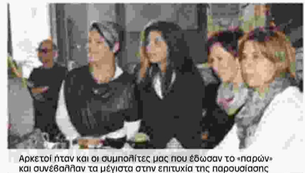
Αρκετοί ήταν και οι συμπολίτες μας που έδωσαν το «παρών» και συνέβαλλαν τα μέγιστα στην επιτυχία της παρουσίασης

αυτοδιοίκηση» όπως τόνισε και ο συγγραφέας επισημαινοντας σε πολλά σημεία της τοποθέτησης του πως όταν ένας πολιτικός διαβάζει λογοτεχνία αντιλαμβάνεται καλύτερα τον λαό, τους πολίτες και τότε μπορεί να κυβερνήσει καλύτερα, γιατί με αυτόν τον τρόπο «αγγίζει τις ψυχές τους». «Πολιτικός, που δεν διαβάζει λογοτεχνία, απευθύνεται σε έναν ξένο λαό» υπογράμμισε ο ίδιος χαρακτηριστικά προβάλλοντας ως παράδειγμα τα συχνά γεύματα μεταξύ Φρανσουα Μιτεράν, Ροζάν Μπαρτ και Χόρχε Λουίς Μπόρχες.