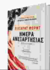
ΡΙΤΣΑΡΝΤ ΦΟΡΝΤ Ημέρα Ανεξαρτησίας Μτφρ.: Θωμάς Σκάσσης Εκδόσεις Πατάκη

Φρανκ Μπάσκομπ (στα ελληνικά έχουν εκδοθεί το πρώτο μέρος, Ο Αθλητικογράφος , και το τρίτο, Η χώρα όπως είναι ), ο κτηματομεσίτης, πρώην αθλητικογράφος και διηγηματογράφος ήρωάς του γίνεται, για μια ακόμα φορά, έστω και άθελά του, ένας υπαρξιακός φιλόσοφος που χαρίζει απογυμνωμένες απαντήσεις στα ανθρώπινα ερωτήματα – ποιος είμαι, πού πάω, γιατί υπάρχω. Όχι τυχαία, κάπου στο τέλος του βιβλίου ο ίδιος αναφέρεται στον Μάρκο Αυρήλιο («Το πνεύμα σου θα διαμορφωθεί ανάλογα με τις σκέψεις σου, γιατί η ψυχή χρωματίζεται από αυτές») και κάπως έτσι φτιάχνεται η πολύχρωμη αφηγηματική παλέτα πάνω σε ένα μονυτό, ασφυκτικό τοπίο: διαβάζοντας τις ατελείωτες περιγραφές των Δυτικών Πολιτειών της Αμερικής έρχονται στον νου οι πίνακες του Χόπερ, οι χρυσές, όπως τις αποκαλεί, εκτάσεις από καλαμπόκι, τα άδεια γήπεδα μπάσκετ, τα μοτέλ και οι ανθρώπινες τραγωδίες που μετράνε το ίδιο με τις αστραφτερές διαφημίσεις. Γι' αυτό και στις αφηγηματικές περιγραφές δεν υπάρχει κρεσέντο αλλά μια υπόκωφη δύναμη που ενδυναμώνει υπαρξιακά τις συνειδήσεις –ιδού ο Μάρκος Αυρήλιος– και κατευθύνει τις