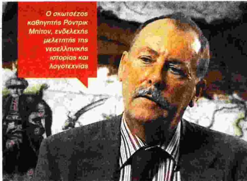
Ο σκωτσέζος καθηγητής Ρόντρικ Μπίτον, ενδελεχής μελετητής της νεοελληνικής ιστορίας και λογοτεχνίας