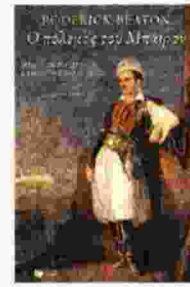
Ρόντρικ Μπίτον Ο ΠΟΛΕΜΟΣ ΤΟΥ ΜΠΑΪΡΟΝ

Μτφ. Κατερίνα Σχινά Σελ. 509, Πατάκης 2015 Τιμή: 19,90