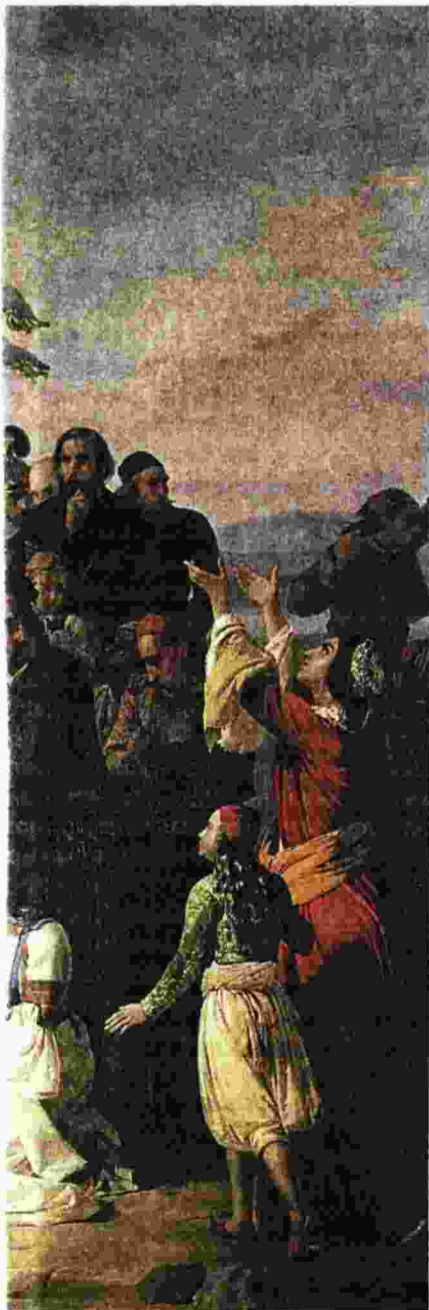
THE ART ARCHIVE / CIVICHE RACCOLTE MUSEO L. BALLO (REVISO) / ALFREDO DAGUCCI

ανοργανωσιά που επικρατούσε στην επαναστατημένη Ελλάδα, τους αποκλίνοντες στόχους των οπλαρχηγών, προεστών, Φιλικών και ιερωμένων, την απέλπιδα προσπάθεια εισαγωγής ευρωπαϊκών αρχών και δικαίου, την αδυναμία κατανόησης από τους ντόπιους των αρχών λειτουργίας ενός σύγχρονου κράτους, τη συχνή, πυκνή υπαγωγή στο παραδοσιακό φιλεττικό δίκαιο, εντέλει την πολιτισμική σύγκρουση. Προσπαθεί περαιτέρω, όπως υπαινιχθήκα και στην αρχή, να αναγάγει τη σημερινή κρίση – υπό τη μορφή μιας υφέρουσας υπόθεσης εργασίας – στην τότε σύγκρουση εσωστρέφειας - εξωστρέφειας, στην κατ' ανάγκην υπαγωγή στις πολιτικές των μεγάλων δυνάμεων και βέβαια στο πρώιμο... χρέος που θα επιβίωνε από τότε υπό ποικίλες μορφές ως τις μέρες των Μνημονίων, της τρόικας και του ΣΥΡΙΖΑ. Υπ' αυτό το πρίσμα θα δει και τη σταδιακή αποθάρρυνση του Μπάρρον εκεί στο Μεσολόγγι, σε έναν κόσμο που από τη μια τον γοητεύει κι από την άλλη ελάχιστα τον κατανοεί: δολοπλοκίες, έριδες, φιλεττικά και οικογενειακά μίσση, εδαφικού τύπου οργάνωση των μικροκοινωνιών, κακοδικίες και κλασικού τύπου προδοσίες θα έρθουν να επικαθήσουν στα εσωτερικά του αδιέξοδα και θα τον οδηγήσουν στον θάνατο από ένα απλό κρύωμα που, πιθανότατα, ο ίδιος αρνήθηκε να θεραπεύσει.