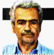
ΓΡΑΦΕΙ Ο ΜΙΧΑΗΛΗΣ ΜΟΛΙΝΟΣ

Εχουν γραφεί πάνω από διακόσιες βιογραφίες του Λόρδου Βύρωνα, ομολογεί εισαγωγικά ο σκωτσέζος καθηγητής, ενδελεχής μελετητής της νεοελληνικής ιστορίας και λογοτεχνίας. Γιατί λοιπόν άλλη μία; Πέραν της ομολογημένης αναθεωρητικής του διάθεσης, ίσως η απάντηση να βρίσκεται στον επικαιρικό, σκανταλιάρικο τίτλο που ο ίδιος επέλεξε να δώσει στην τελευταία διάλεξή του στο Μέγαρο Μουσικής («Ήταν ο Μπίτον μνημονιακός;»). Καταλαβαίνει εύκολα κανείς το γιατί η εξουσιαστική αυτή μελέτη παρουσιάστηκε έκτοτε στον Τύπο υπό το πρίσμα αυτού ακριβώς του ερωτήματος που μονοπωλεί την επικαιρότητα και διαιρεί την ελληνική κοινωνία εδώ και έξι τουλάχιστον χρόνια, χωρίς μάλιστα το οχίσμα να δείχνει σημάδια κόπωσης.