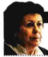
ΓΡΑΦΕΙ Η ΡΕΝΑ ΜΟΛΧΟ

Ο Χάρης Βλαβιανός δεν χρειάζεται συστάσεις. Γνωστός ποιητής και ιστορικός, στο νέο του βιβλίο συνδυάζει και τις δύο αυτές ιδιότητες. Ως ιστορικός, αναπαριστά με τρόπο συγκλονιστικό τον κόσμο του Χίτλερ και τον πιθανό «διάλογο» του δικτάτορα με τους «θεωρητικούς» του ρατσισμού που συνθέτουν την ιδεολογική βιβλιοθήκη του (Φίχτε, Βάγκνερ, Χένρι Φορντ, Φρίντριχ Νίτσε, Πολ Ντέξτερ, Ντίτριχ Εκκαρτ κ.ά.). Ως δημιουργός, ανασυνθέτει με δεξιοτεχνία τον ψυχισμό του διαβόητου ναζιστή ηγέτη.