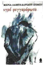
«ΥΓΡΟ ΦΕΓΓΑΡΟ- ΦΩΤΟ» της Μαρίας Λαμπαδαρίδου - Πόθου. Εκδ. «Κέδρος», σελ. 416, € 18.

«Εκείνος ήταν ο διαφορετικός. Και ήξερε πως από είναι μοναξιά και πως θα είναι για πάντα. Οι θεοί τον είχαν σημαδέψει για να τον ριξουν αβύσσου στην περιπέτεια του ανεξήγητου».