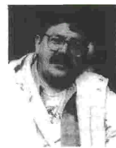
Το νέο αστυνομικό μυθιστόρημα του Πάκο Ιγνάσιο Τάιμπο II «Ερωτευμένα φαντάσματα» θα κυκλοφορήσει από τις εκδόσεις «Άγρα».