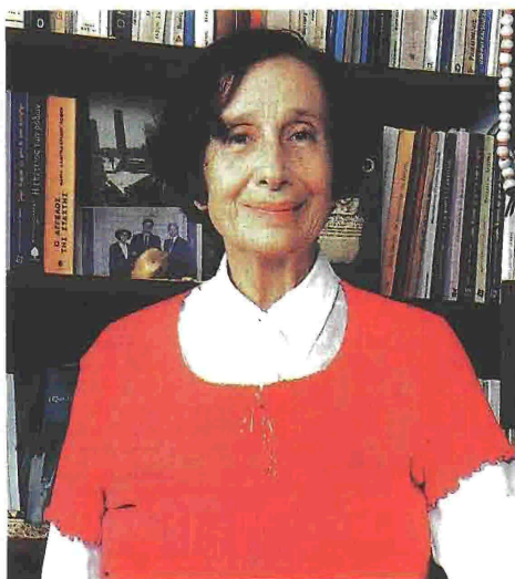
ΠΟΥΛΥΕΠΙΠΕΔΟ, ΑΛΛΗΓΟΡΙΚΟ και υπαινικτικό το 17ο μυθιστόρημα της Λαμπαριδίου - Πόθου «Υγρό Φεγγαρόφωτο» βάζει στο μικροσκόπιο το ανθρώπινο αίνιγμα.