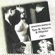
ΦΡΑΝΣΟΥΑ ΦΟΡΕΣΤΙΕ «Τζον Φ. Κένεντι & Μέριλιν» Μελάνι, σελ. 311

Ο πόλεμος της Αλγερίας τελειώνει. Πέντε χρόνια μετά, στη Μασσαλία, ένας νεκρός σε μια φοιτητική εστία θα φέρει τον αστυνομικό Πάκο Μαρτινέθ και τον Κουρτιγκιάν, τον συνεργάτη του, κοντά στους φοιτητές και τις πολιτικές τους ανησυχίες. Η αστυνομική έρευνα δεν καταλήγει ποθενά, οι θάνατοι διαδέχονται ο ένας τον άλλο. Υπόκοσμος και παρακρατικοί, άνθρωποι της σιαιής, υπέρτες της ακίας, κινούνται στη Μασσαλία. Ποιος κρύβεται πίσω τους και τι επιδιώκει;