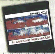
MAURICE ATTIA «Η κόκκινη Μασσαλία» Πάρις, σελ. 548

Ο πόλεμος της Αλγερίας τελειώνει. Πέντε χρόνια μετά, στη Μασσαλία, ένας νεκρός σε μια φοιτητική εστία θα φέρει τον αστυνομικό Πάκο Μαρτινέθ και τον Κουρτιγκιάν, τον συνεργάτη του, κοντά στους φοιτητές και τις πολιτικές τους ανησυχίες. Η αστυνομική έρευνα δεν καταλήγει ποθενά, οι θάνατοι διαδέχονται ο ένας τον άλλο. Υπόκοσμος και παρακρατικοί, άνθρωποι της σιαιής, υπέρτες της ακίας, κινούνται στη Μασσαλία. Ποιος κρύβεται πίσω τους και τι επιδιώκει;