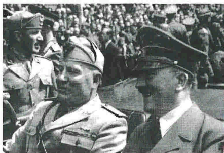
Η συμμαχία του Μουσολίνι με τον Χίτλερ ήταν ετεροβαρής. Ο Γερμανός αποφάσισε, ο Ιταλός ακολουθούσε από μεγάλη απόσταση, χωρίς να γνωρίζει τα σχέδια του συμμάχου του.

Εκινάμε από εκεί που σταματήσαμε πριν από εξακόσια χρόνια, έλεγε ο Χίτλερ, θυμίζοντας τον Μπαρμπαρόσα και την πρόσφατη συνθήκη του Μπρεστ-Λι-