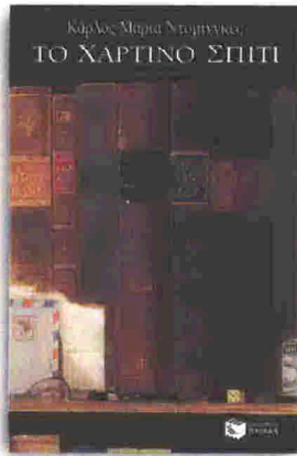
Το χάρτινο σπίτι Εκδόσεις Πατάκη 2008 σελ.: 107, τιμή: 8,40 ευρώ