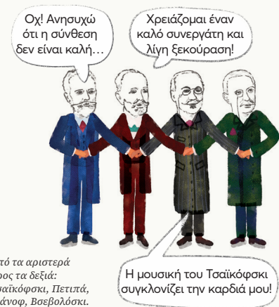
Από τα αριστερά προς τα δεξιά: Τσαϊκόφσκι, Πετιπά, Ιβάνοφ, Βσεβολόσκι.

Όλα ξεκίνησαν το 1877, όταν ανέβηκε στη Ρωσία η πρώτη εκδοχή της Λίμνης των Κύκνων . Κι όσο και αν δεν μπορούμε να το φανταστούμε, ήταν σκέτη αποτυχία! Παρά την υπέροχη μουσική του Πιοτρ Ίλιτς Τσαϊκόφσκι, η σκοτεινή πλοκή της και η χορογραφία δεν ενθουσίασαν κοινό και κριτικούς. Έτσι, όλοι ξέχασαν το έργο γρήγορα. Όλοι; Όχι όλοι! Το θυμόταν ο Ιβάν Βσεβολόσκι, ο διευθυντής του Θεάτρου Μαρίνσκι της Αγίας Πετρούπολης. Δηλαδή ο κατάλληλος άνθρωπος στην κατάλληλη θέση! Εκείνος πίστευε στη δύναμη του έργου και συντόνισε ένα νέο ανέβασμα από μια πολύ ικανή ομάδα, μια «dream team» όπως θα λέγαμε και στο μπάσκετ! Η δεύτερη πλήρης εκδοχή της «Λίμνης» παρουσιάστηκε στις 15 Ιανουαρίου του 1895 και έκτοτε ζει και βασιλεύει!