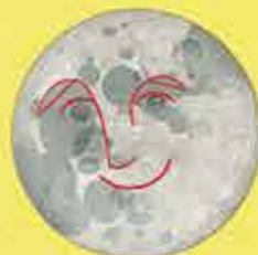
Πρόσωπο (Βόρεια Αμερική)