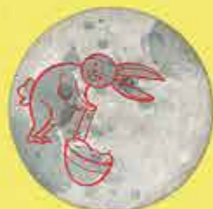
Κουνέλι που πολτοποιεί ρύζι (Ανατολική Ασία)