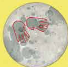
Αποτυώματα χεριών (Ινδία)