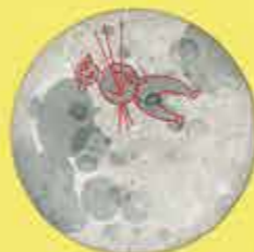
Άντρας που κουβαλάει ξύλα (Ευρώπη)