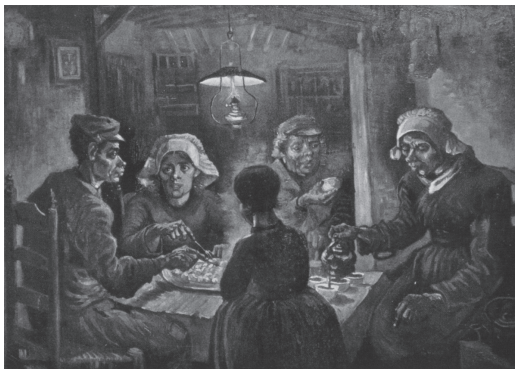
Βαν Γκογκ, Οι πατατοφάγοι , 1885, Μουσείο Βαν Γκογκ, Άμστερνταμ. Σκηνή από τη σκληρή ζωή των ανθρακορύχων του 19ου αιώνα.

Από την αρχαιότητα κιάλας πολλοί στοχαστές ασχολήθηκαν με την οργάνωση και τη λειτουργία των κοινωνικών ομάδων, των πόλεων, και αναζήτησαν τα αίτια της φτώχειας, των πολέμων κτλ. Οι πιο γνωστοί είναι ο Πλάτωνας, ο Αριστοτέλης, ο Ξενοφώντας, ο Θουκυδίδης, ο Πλούταρχος, οι σοφιστές. Όμως, παρά το αξιόλογο έργο τους, η συστηματική επιστημονική μελέτη της κοινωνίας και των κοινωνικών φαινομένων ξεκινά πριν από 150 περίπου χρόνια, στα μέσα του 19ου αιώνα. Πριν τον 19ο αιώνα έχουμε αναπτυγμένο τον κοινωνικό στοχασμό, σκέψεις πάνω στο ποια είναι η φύση του ανθρώπου, πώς πρέπει να οργανωθούν καλύτερα η οικονομία, η κοινωνία και η πολιτεία. Όμως αυτός ο στοχασμός δεν είναι επιστημονική ανάλυση της κοινωνίας. Η προσπάθεια επιστημονικής ανάλυσης της κοινωνίας ξεκινά ουσιαστικά τον 19ο αιώνα και μέσα από την ανάπτυξή του προκύπτει η επιστήμη της Κοινωνιολογίας.